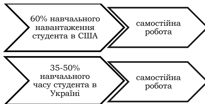
Рис. 3. Розподіл навчального навантаження на самостійну навчальну діяльність в США і в Україні

керівництвом викладача), обов'язково виконати завдання блокової практики в одному із закладів соціального захисту (агентство соціального захисту) з надання соціальної допомоги, і розробити підсумковий соціальний проект по роботі з тією групою клієнтів, з якою проходили блокову практику. В Україні ж цю кількість кредитів розподіляють лише на аудиторне навантаження і виконання завдань самостійної навчальної роботи студента.